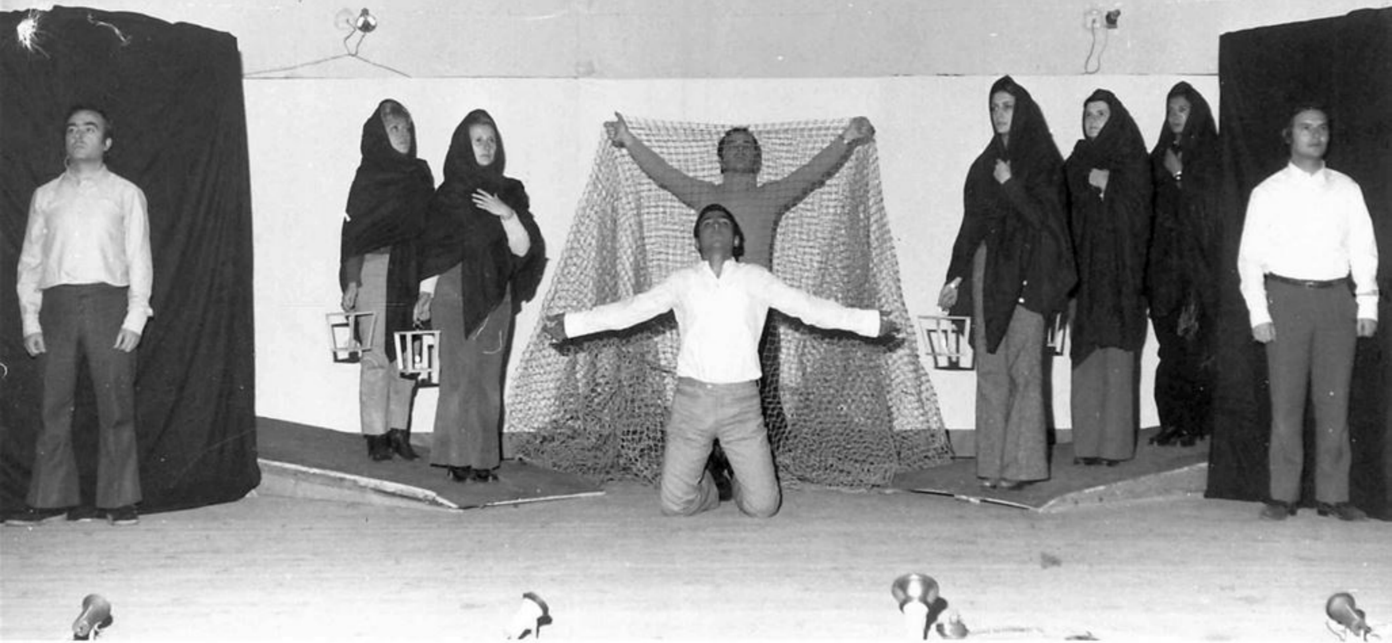
Las Razones del Cante, en el Colegio Menor de Jerez